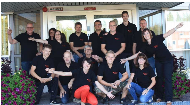
Kokemäen Sähkön henkilökunta yhtiön konttorilla 21.8.2014.