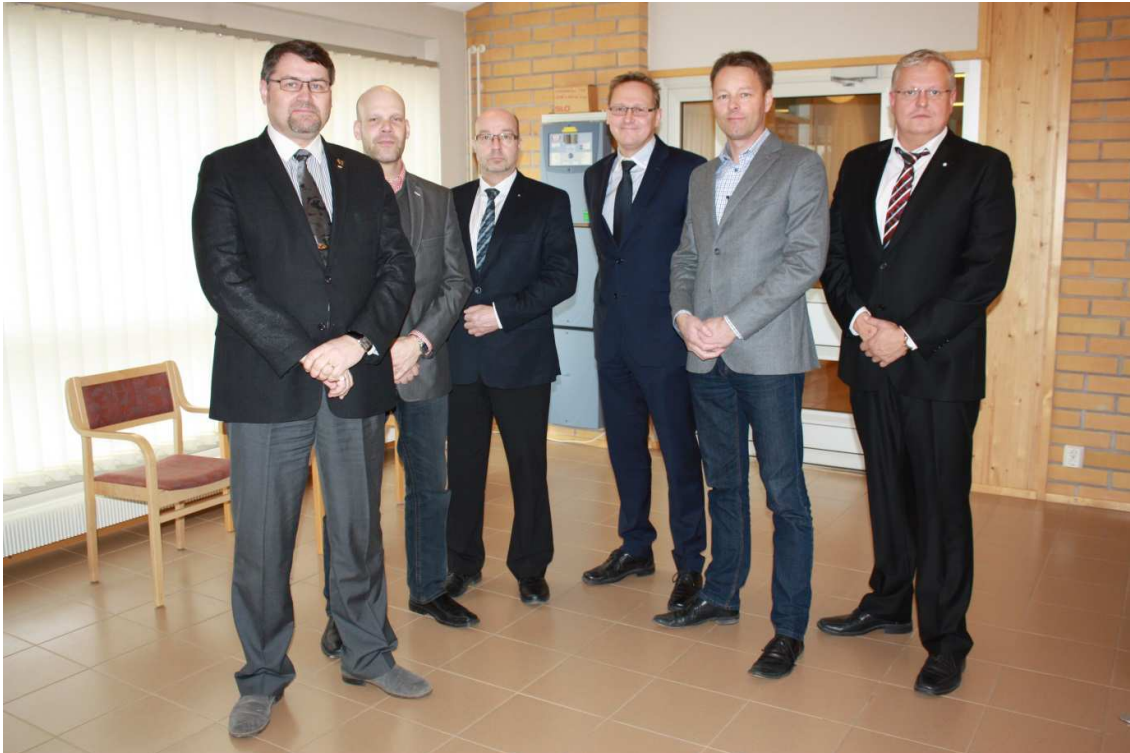
Kokemäen Sähkön hallitus yhtiön konttorilla 31.3.2015