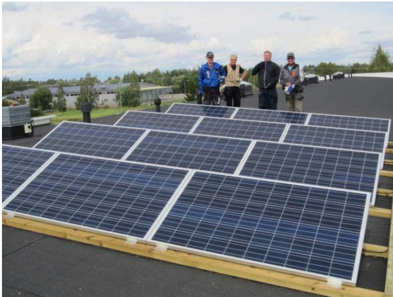
Kokemäen Sähkön aurinkopaneelijärjestelmän asennusporukka asennuksen jälkeen 14.8.2014.