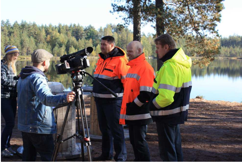
Palojärven lehdistötilaisuus 16.9.2014.

Tiistaina 16.9.2014 paikalliset sähköyhtiöt, Kokemäen Sähkö, Köyliön-Säkylän Sähkö, Lammaisten Energia ja Paneliankosken Voima järjestivät tiedotustilaisuuden viestiäkseen pienten ja paikallisten sähköyhtiöiden säilyttämisen tärkeydestä. Tilaisuuteen osallistui medioita aina YLE:stä lähtien.