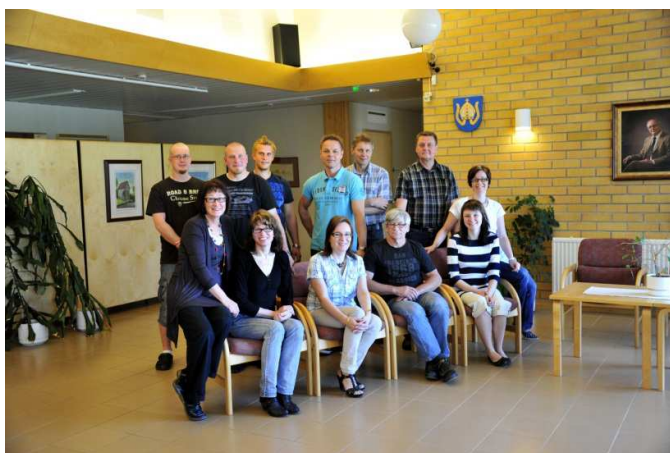
Henkilökunnan kuva vuodelta 2012

Toimintavuoden aikana yhtiössä työskenteli kolme henkeä eripituisissa määräaikaaisissa työsuhteissa. Kesätyöntekijöitä oli asentajien apuna sekä kiinteistön ylläpitotehtävissä.