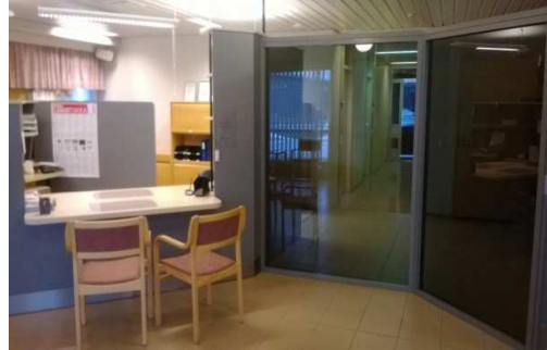
Yhtiön asiakaspalvelutila ennen ja jälkeen uudistuksen